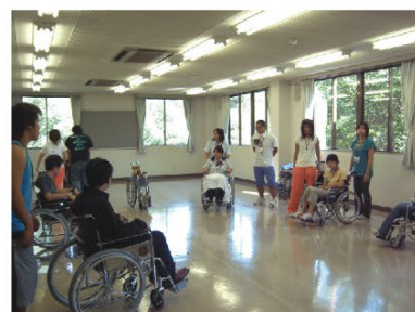
▲先輩たちと車椅子で校内一周