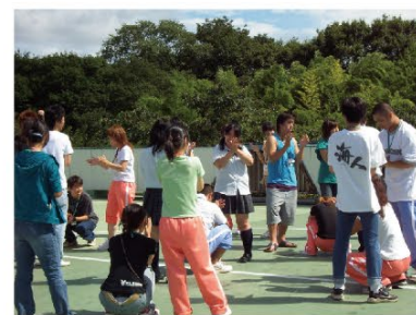
▲みんなでレクリエーション体験